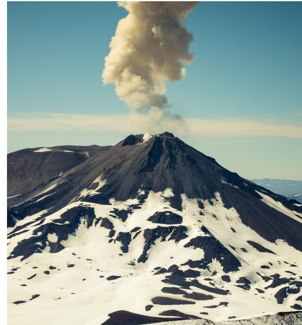
Figura 1. Complejo volcánico Nevados de Chillán

Se utilizó un diseño de caso cualitativo , de corte fenomenológico , seleccionando intencionadamente a 15 personas mayores. Los datos son producidos mediante entrevistas semiestructuradas y un grupo focal , utilizando como estrategia de análisis el proceso de codificación de la teoría fundamentada (Coller, 2005; Flick, 2007).